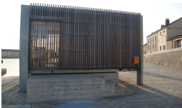
téléphone SOS externe, situé en façade de la cabine de l'écluse de Gray

Si vous êtes à proximité, les écluses suivantes sont joignables par téléphone ou VHF sur la Saône petit gabarit :